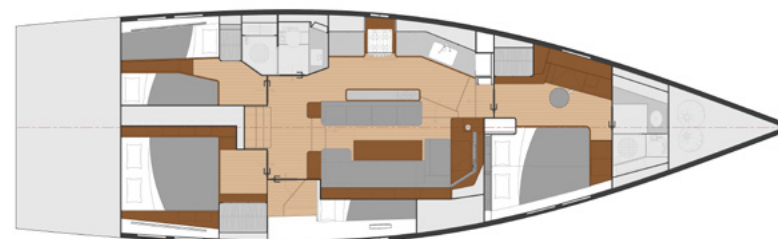
MULTI VERSION — 4 CABINS